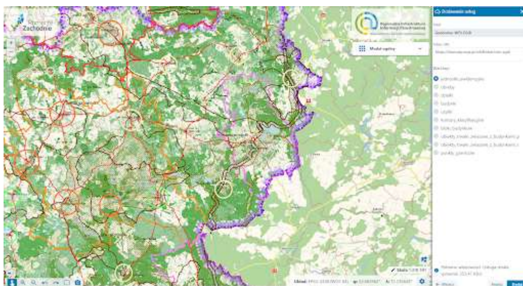
Zdjęcie nr 3 – Podłączenie usługi sieciowej WFS do mapy

Oparcie Portalu RIIP WZ na usługach sieciowych umożliwia różnorodną prezentację graficzną zgromadzonych danych poprzez wygenerowanie warstw, które są w obszarze zainteresowania użytkownika.